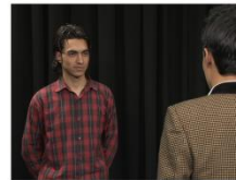
Over the Shoulder Shot (OS)