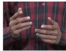
Detail Shot or Sequence