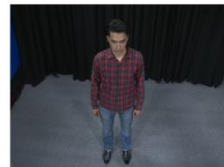
Top shot, Aerial Shot (TS or AS)