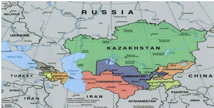
شکل ۴: ( https://en.wikipedia.org/wiki/Central_Asia )

پدې سیمیز سیستم کې د پنځو هېوادونو (ازبکستان، تاجکستان، قرغیزستان، قزاقستان او ترکمنستان) سربېره، پنځه سیمیز ځواکونه (روسیه، ایران، ترکیه، هند او پاکستان) او درې نړیوال ځواکونه (امریکا،