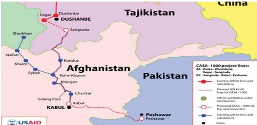
شکل ۱: (Amu Tv)

د مرکزي آسیا له هېوادونو څخه د جنوبي آسیا هېوادونو ته؛ د افغانستان له مسیر څخه د برېښنا د انرژۍ لېږد د مرکزي آسیا او د جنوبي آسیا د هېوادونو ګډې اقتصادي ګټې په یوه سیمیزه سوداګرۍ کې تر لاسه کېدلای شي. د افغانستان ونډه په سیمه کې د برېښنا د انرژۍ د لېږد په برخه کې د یو اغېزمن هېواد په توګه تثبیت شوېده او په عین حال کې لدې پروژې څخه د برېښنا د انرژۍ د ترانزېټ له لارې د عوایدو ترلاسه کول د افغانستان د اقتصادي ودې او ثبات د بیاوړتیا لپاره یو مهم لامل ګڼل کېدلای شي (mew.gov.af) او (وریج کاظمی، ۲۰۰۴:۱۴۰۰).