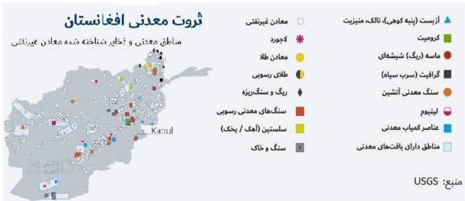
شکل ۳: (USGS)

د امريكايي اشغال په دوره كې د امريكا لخوا د ځينو معدني ذخيرو د چپاول خبرونه خپاره شول. د المونيم، طلا، سپينو زرو، روى او جيوه د سترو معدنونو تر څنگ، د غزني ولايت د لومړنۍ تجزيې او تحليل له مخې ليدل كيري چې په دې سيمه كې د بوليويا د هېواد د ليتيومو د سترو ذخيرو په اندازه (۲۱) ميليون ټنه ليتيوم لري، د يو راپور له مخې، په يوه نظر سنجونه كې چې په (۲۰۱۰) ميلادي كال كې تر سره شوه، هغه ځمكپوهانو او څېړنكو چې د متحده ايالاتو نظامي برخې ته يې كار ترسره كولو، د افغانستان د ليتيومو ارزښت چې په غزني، هرات او نيمروز ولايتونو كې شتون لري؛ درې تريليونه ډالر اټكل كړى دى.